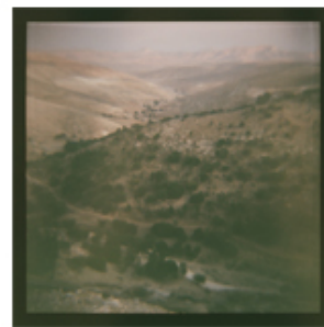
Raffaella Crispino Untitled (15 foto) 2010 lambda prints su carta Kodak ed. 1 + 1 Ap 190 x 140 cm.