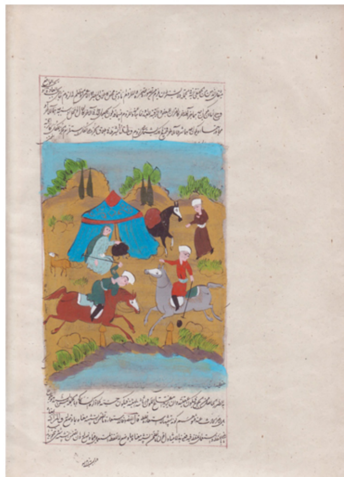
Raffaella Crispino Here no politics, no war, just simple stories (antica illustrazione persiana dell'800, dipinto e scritto a mano) 2010 dipinto persiano su carta, targhetta d'ottone, cornice 40x52 cm.