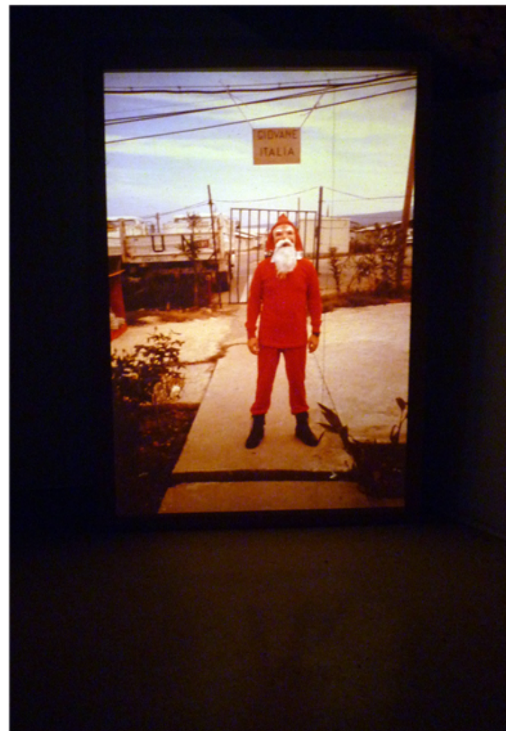
Raffaella Crispino Giovane Italia 2010 diapositiva su pannello di legno dimensioni variabili ed. 3 + 2 Ap