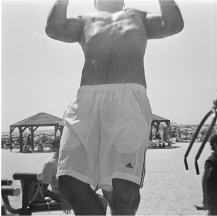
Raffaella Crispino Untitled 2009 fotografia analogica b/w lambda print su carta Kodak, cornice 70x70 cm.