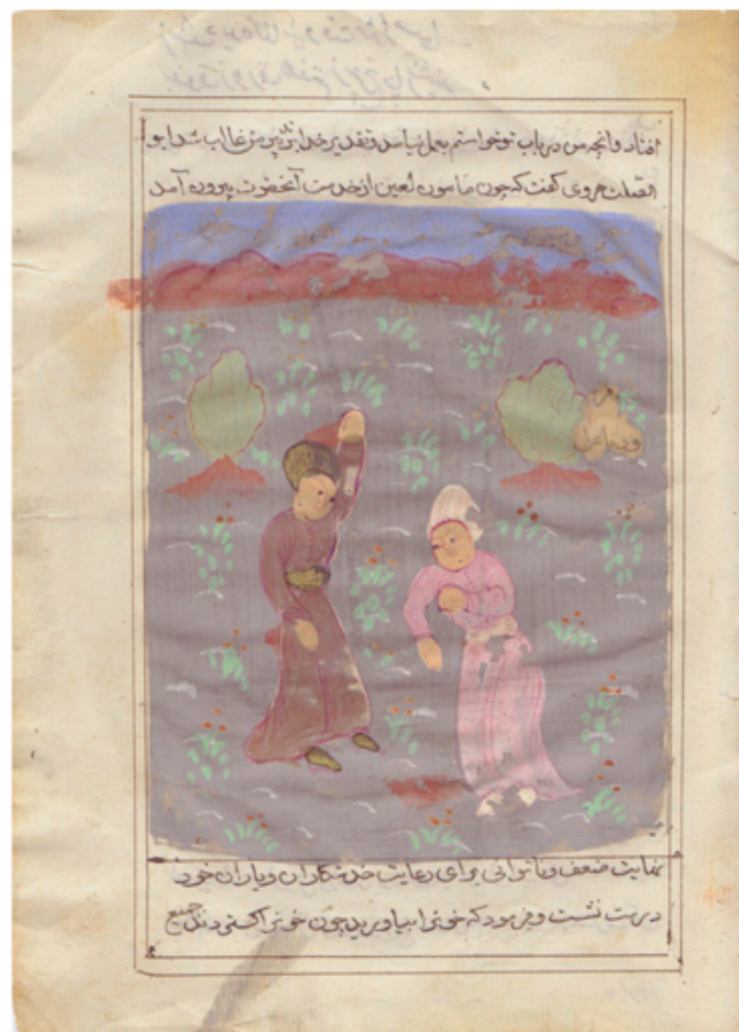
Raffaella Crispino Here no politics, no war, just simple stories (antica illustrazione persiana dell'800, dipinto e scritto a mano) 2010 dipinto persiano su carta, targhetta d'ottone, cornice 40x52 cm.