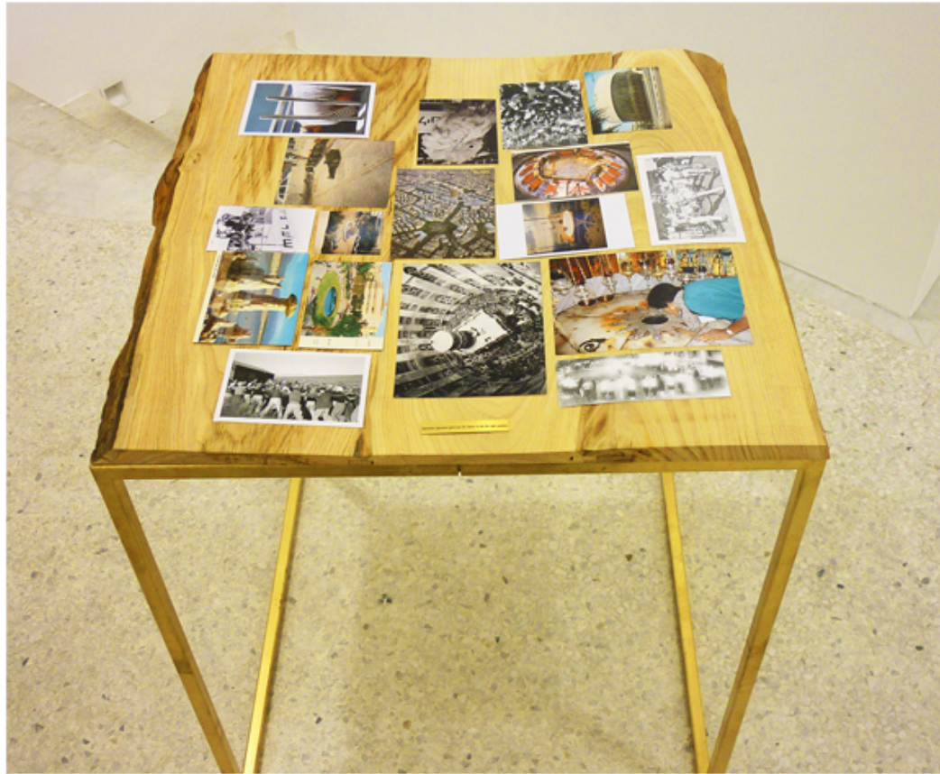
Raffaella Crispino Sometimes ignorance gives you the chance to ask the right question 2010 legno (noce), ferro, targhetta d'ottone, stampe, cartoline, fotografie 71x71x82 cm