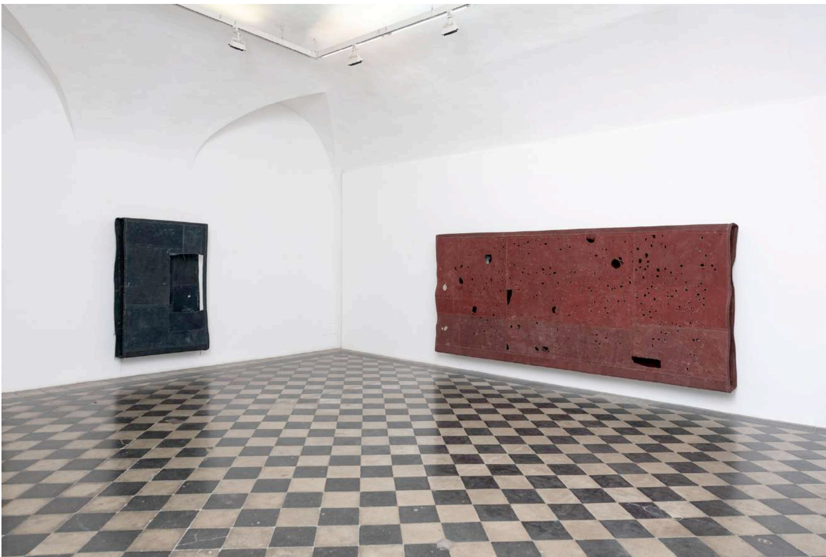
Simon Gallery | Valentina D'Amaro, installation view, Photo credit: Giorgio Benni