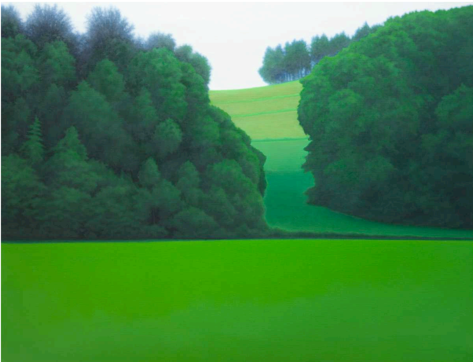
Valentina D'Amato , Senza titolo, from the series Viridis, 2019, oil on canvas, 90 x 120 cm