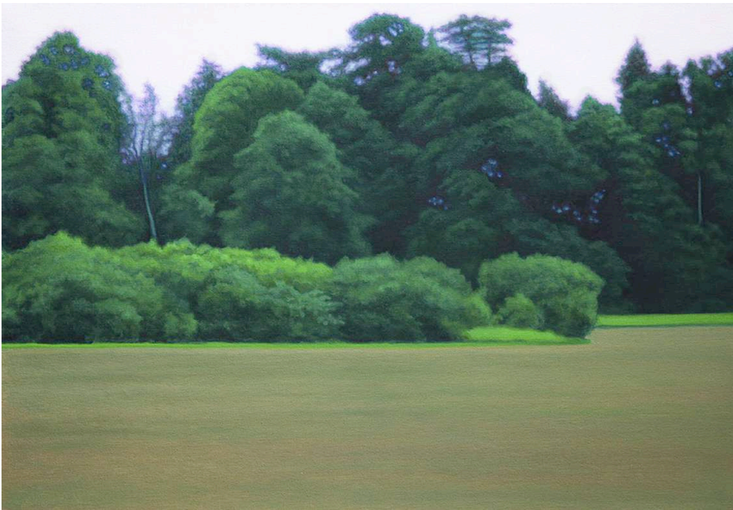
Valentina D'Amaro , Senza titolo, from the series Viridis, 2019, oil and glitters on canvas 55 x 80 cm