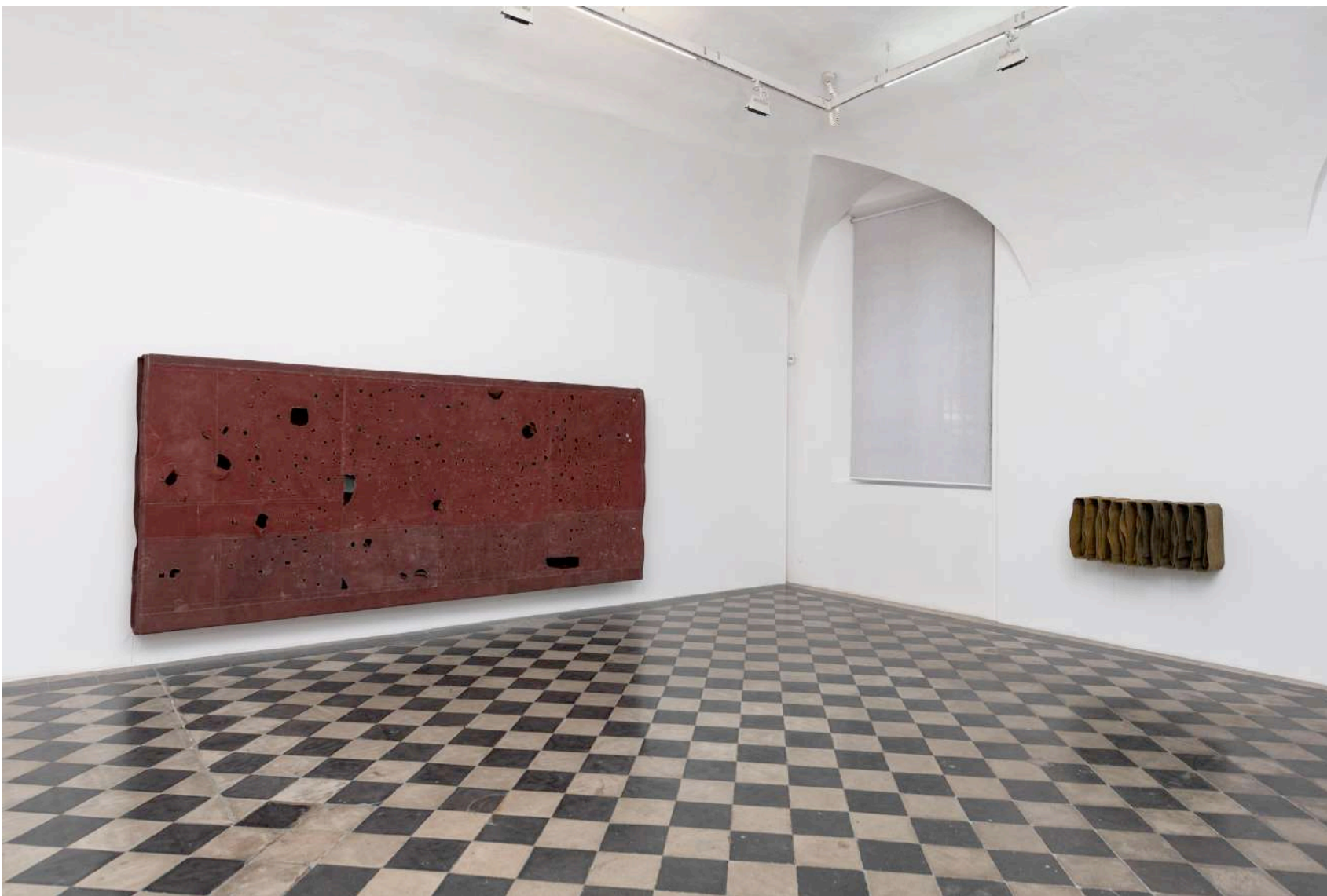
Simon Gallery | Valentina D'Amato, installation view