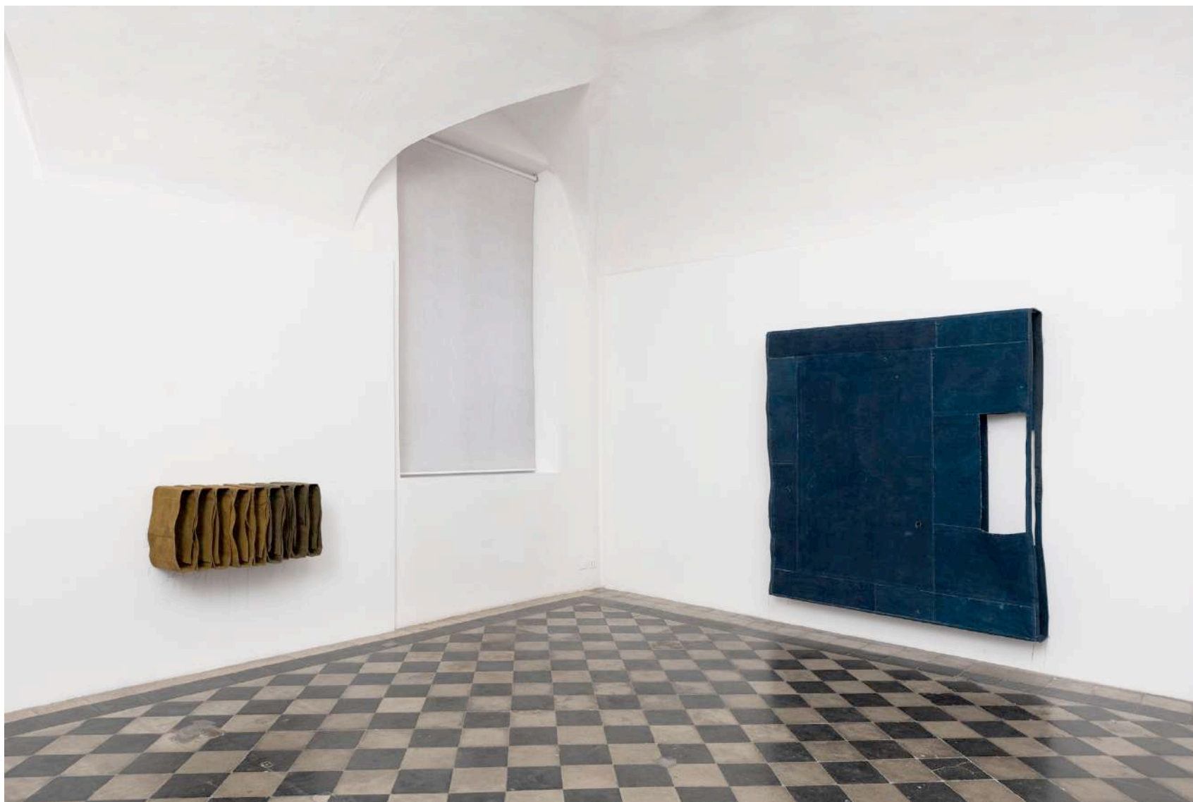
Simon Gallery | Valentina D'Amaro, installation view, Photo credit: Giorgio Benni