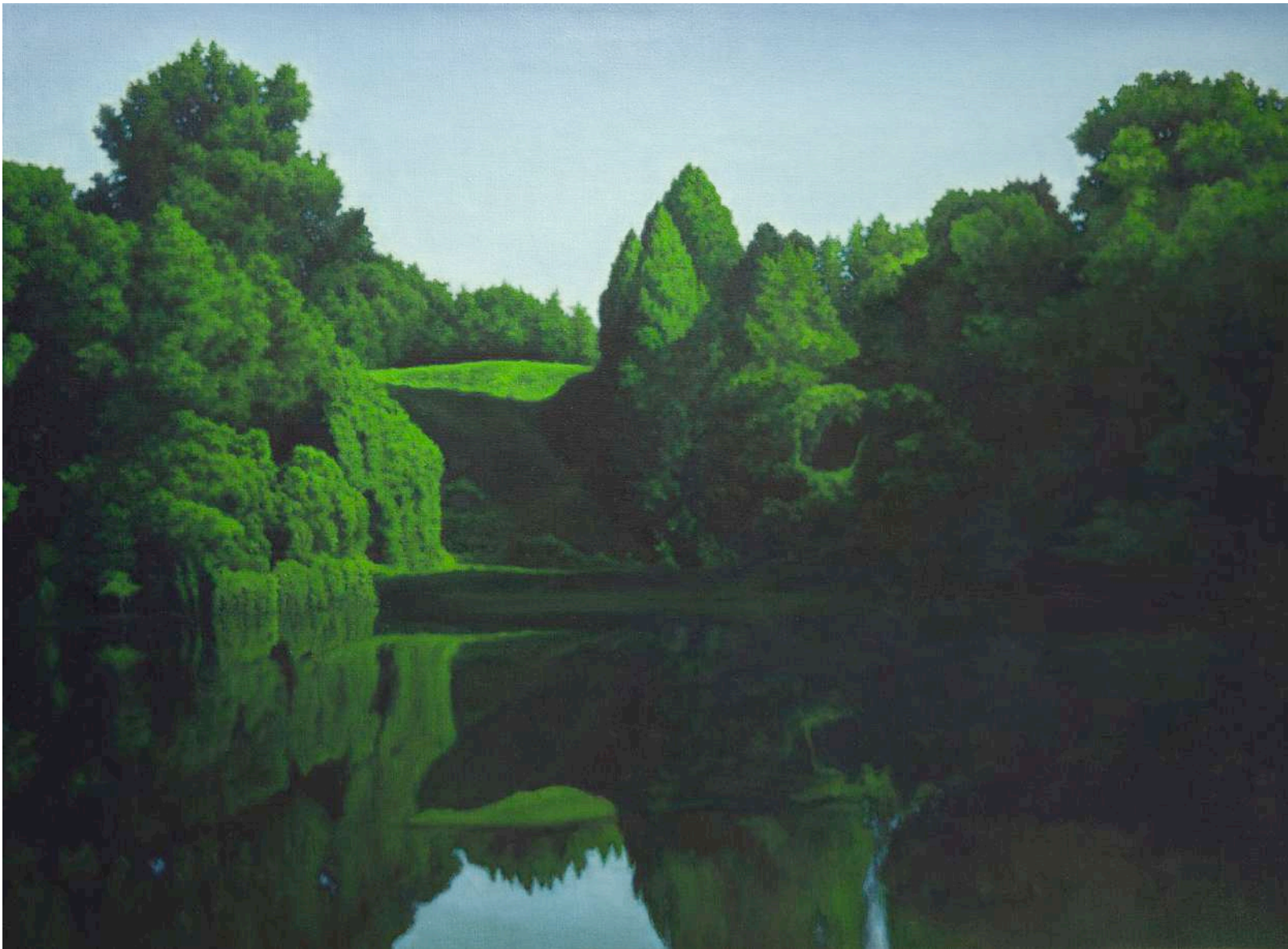
Valentina D'Amaro , Senza Titolo, from the series Viridis, 2016, oil on canvas, 87 x 118 cm