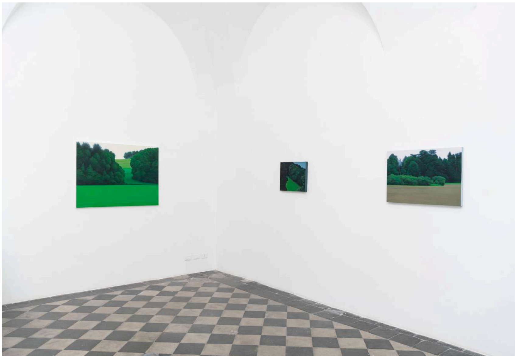
Simon Gallery | Valentina D'Amaro, installation view