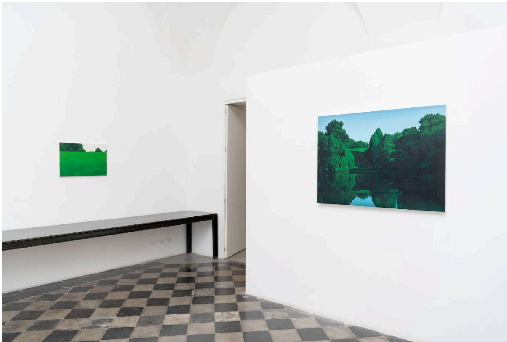
Simon Gallery | Valentina D'Amaro, installation view, Photo credit: Giorgio Benni