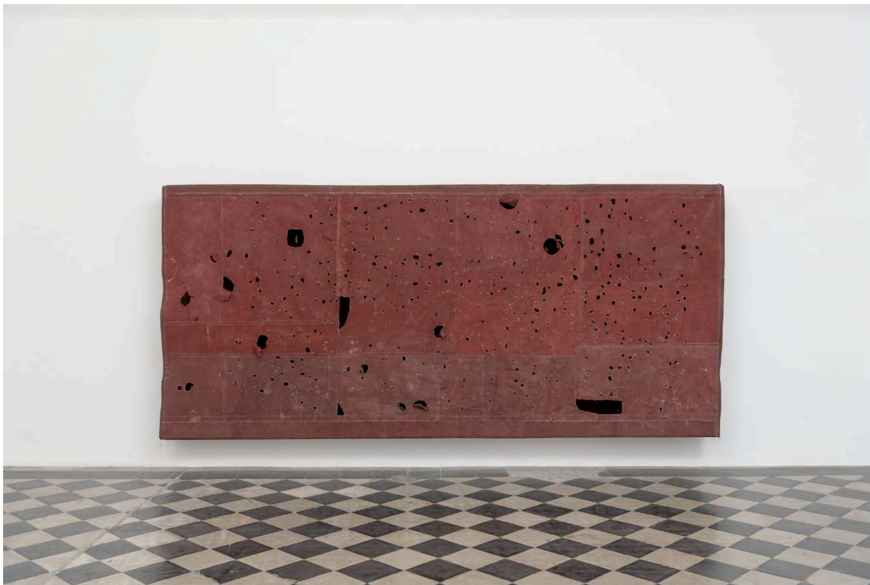
Simon Callery , Contact Painting. Rome (Alessandrino), 2019, canvas, distemper, thread, wood, 187 x 410 x 35 cm