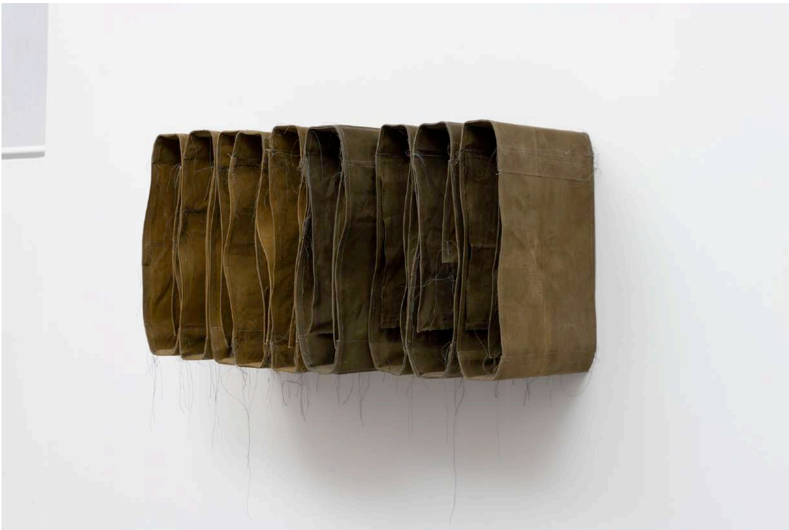
Simon Callery , Rural Wallspine, 2019, canvas, distemper, thread, wood, 50 x 93 x 42 cm